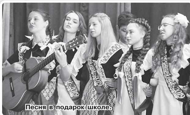
Песня в подарок школе.

И вот кульминационный момент: звенит последний, прощальный звонок для выпускников! Право его