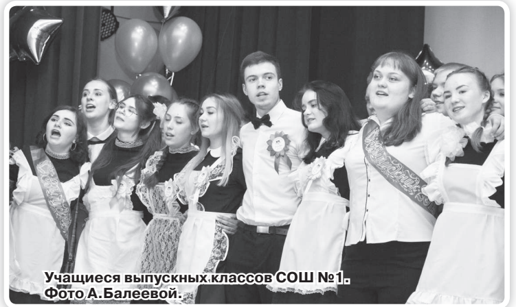
Учащиеся выпускных классов СОШ №1.