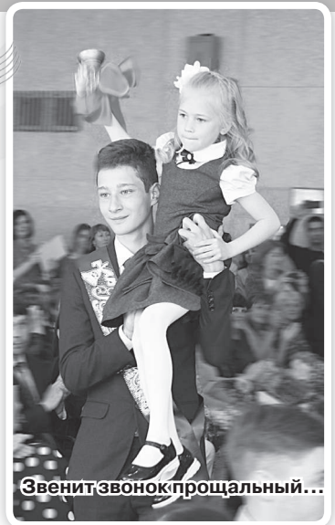
Звенит звонок прощальный...