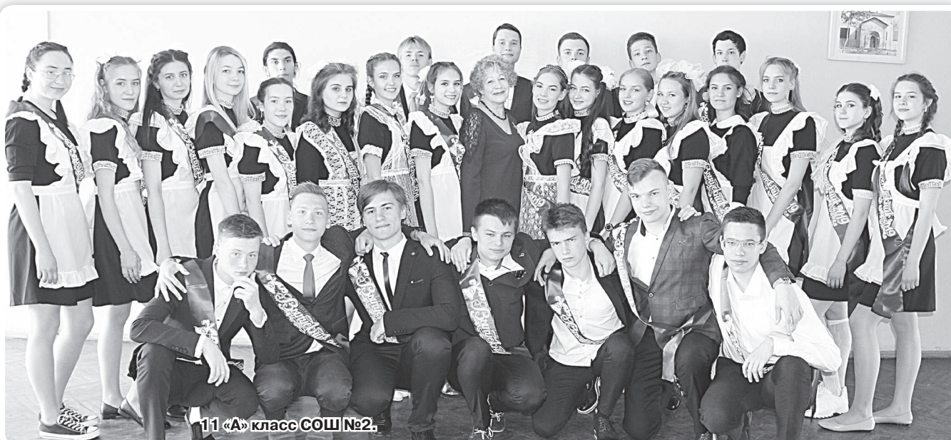
11 «А» класс СОШ №2.