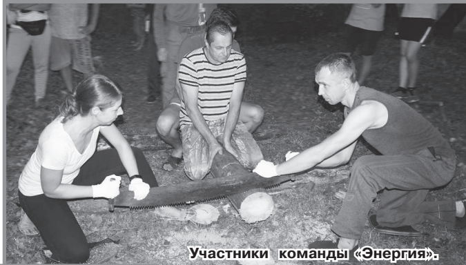
Участники команды «Энергия».