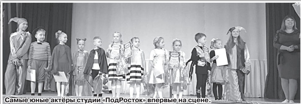
Самые юные актёры студии «ПодРосток» впервые на сцене.

Второй день театрального марафона открыл спектакль студии «ПодРосток» по мотивам сказки К. Чуковского «Именины Мухи - Цокотухи». В этом спектакле дебютировали самые маленькие участники студии. Их первый выход на сцену был незабываемым. Родители и зрители были в восторге от живой, непосредственной игры малышей, их ярких костюмов, декораций. Поздрав-