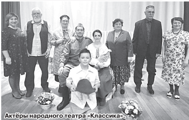
Актёры народного театра «Классика».