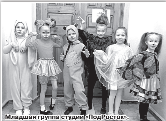
Младшая группа студии «ПодРосток».