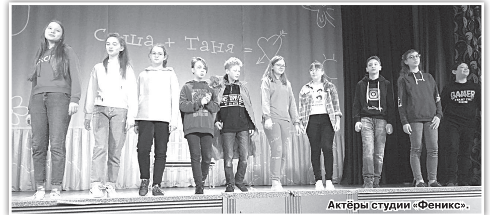
Актёры студии «Феникс».