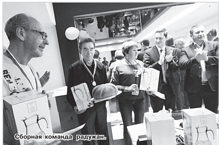
Сборная команда радужан.