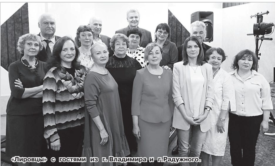
«Лировцы» с гостями из г.Владимира и г.Радужного.