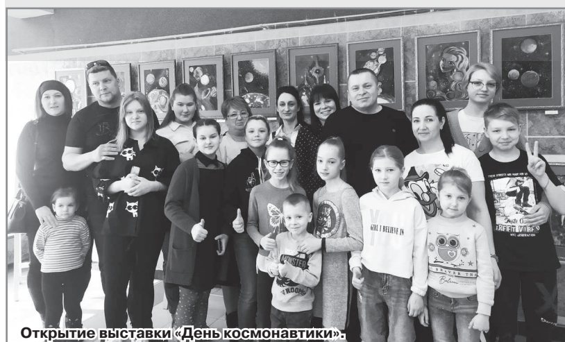
Открытие выставки «День космонавтики».