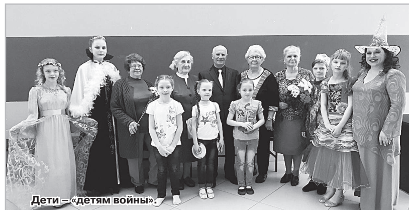
Дети – «детям войны».