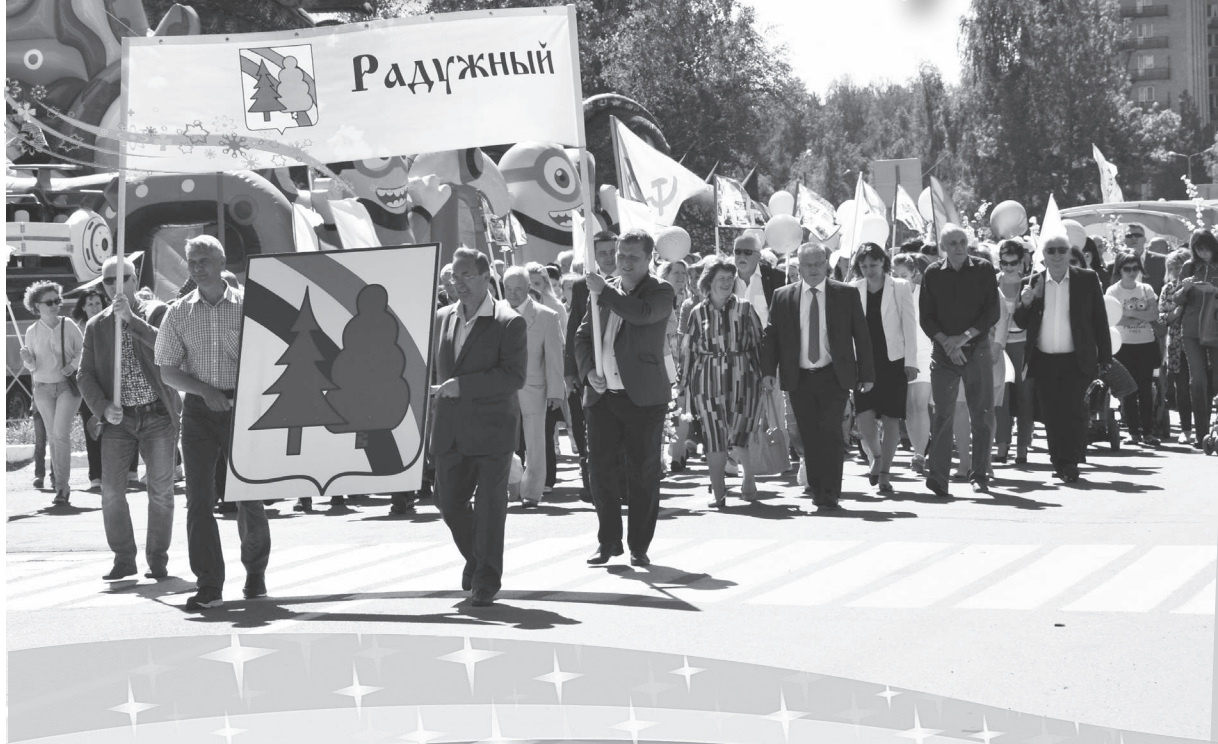
День города-2019.