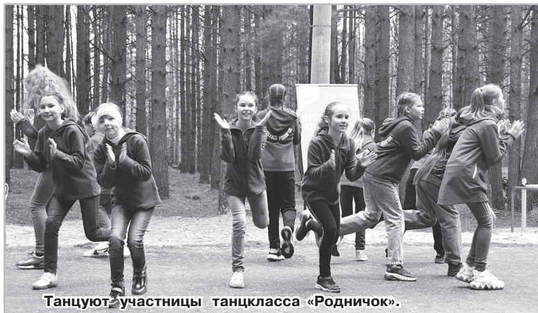
Танцуют участницы танцкласса «Родничок».

Напомним, что в парке установлены биотуалеты, которыми могут пользоваться все посетители. Приглашаем всех радужан в парк для проведения досуга, и надеемся, что жители города будут бережно и аккуратно относиться ко всему, что для них сделано, и не мусорить. В этот день многочисленная детвора с удовольствием каталась на аттракционах и опробовала новые игровые комплексы, которыми пополнился парк.