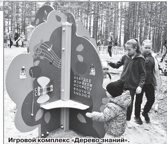
Игровой комплекс «Дерево знаний».

Наш парк обновился, и людям это очень нравится, многие приходят, благодарят, - рассказал пред-