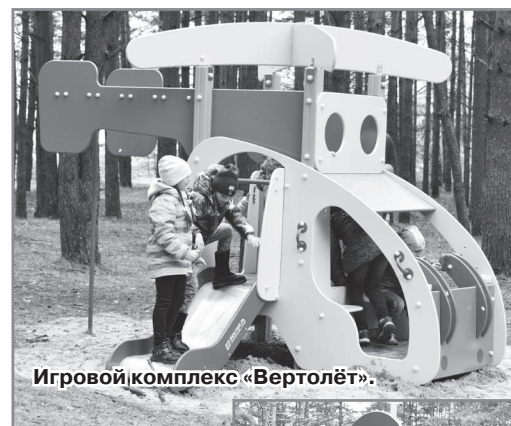
Игровой комплекс «Вертолёт».

В парке в этот день также работали волонтеры проекта «Формирование комфортной городской среды», в рамках которого продолжается всероссийское рейтинговое голосование за объекты благоустройства.