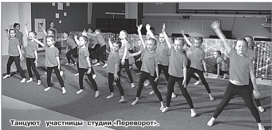
Танцуют участницы студии «Переворот».