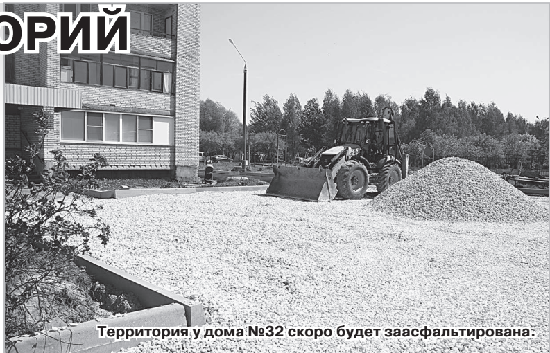
Территория у дома №32 скоро будет заасфальтирована.

- Мы не первый раз выполняем работы в городе Радужном, - рас-