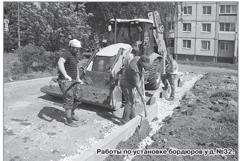
Работы по установке бордюров у д.№32.