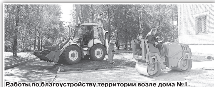
Работы по благоустройству территории возле дома №1.

новка нового бортового камня и асфальтирование, начнутся в ближайшее время.