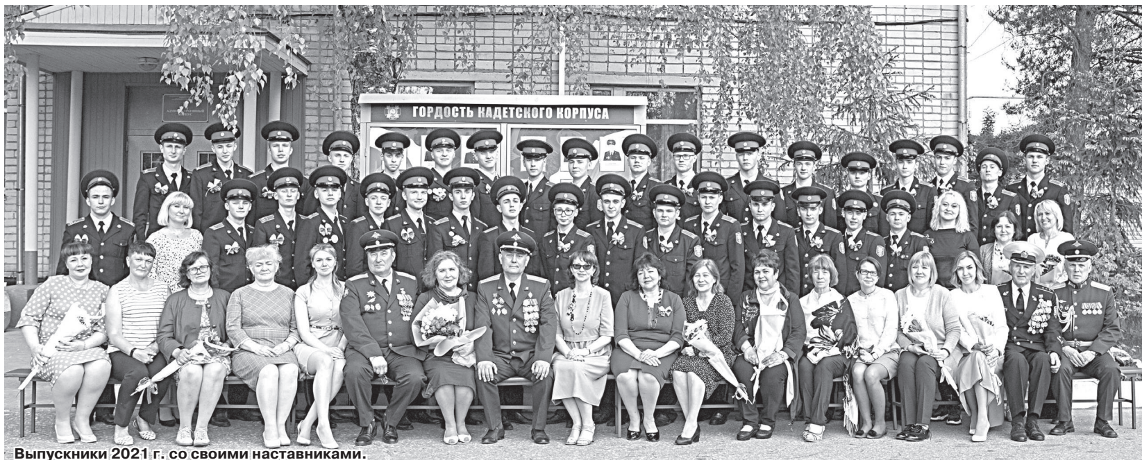
Выпускники 2021 г. со своими наставниками.

Родители выпускников 2021 г. ГКОУ ВО «Кадетский корпус» им. Д. М. Пожарского.