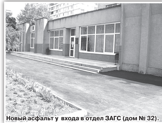
Новый асфальт у входа в отдел ЗАГС (дом № 32).