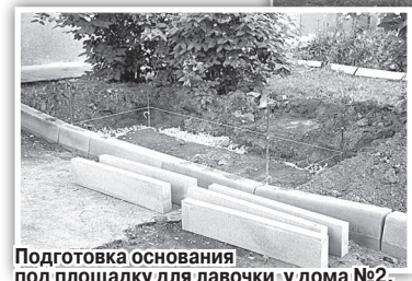
Подготовка основания под площадку для лавочки у дома №2.

пока не возникает. В сильный дождь работы не ведём, естественно. Следим за погодой. Все гарантийные обязательства выполняем.