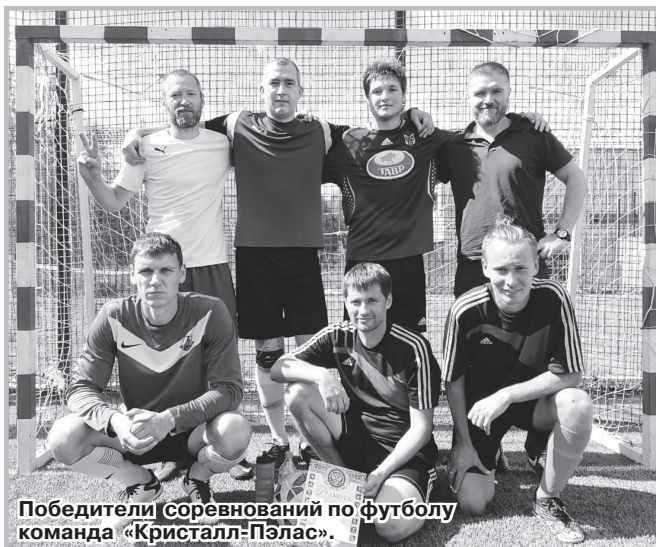
Победители соревнований по футболу команда «Кристалл-Пэлас».

приходится старшему поколению пока держать марку. Молодые ребята приходят заниматься, но перспективных игроков от силы 5 человек».