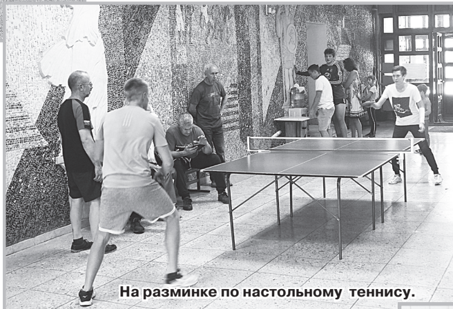
На разминке по настольному теннису.