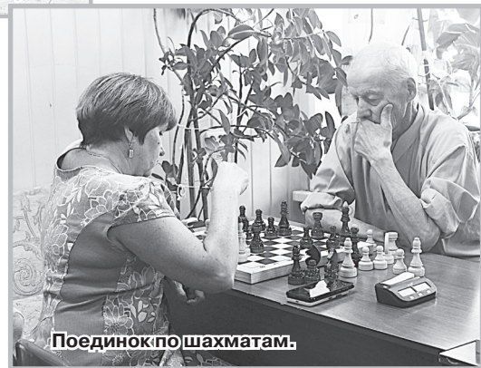
Поединок по шахматам.

На втором этаже спортивного зала «Кристалл» в очном противостоянии выявляли сильнейшую команду «Ветераны», «МЧС» и «Молодежь». Несмотря на