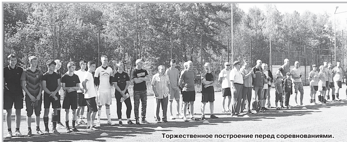
Торжественное построение перед соревнованиями.

И. Митрохина.