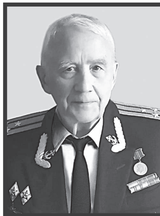
Администрация ЗАТО г. Радужный. Городской Совет ветеранов ЗАТО г. Радужный.