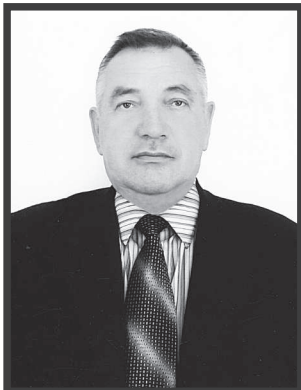
ГРАФИК ПРИЁМА ГРАЖДАН

депутатами СНД, представителями исполнительных органов власти