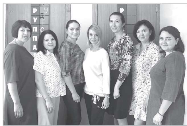
На фото: работники д/с №6 «Сказка».