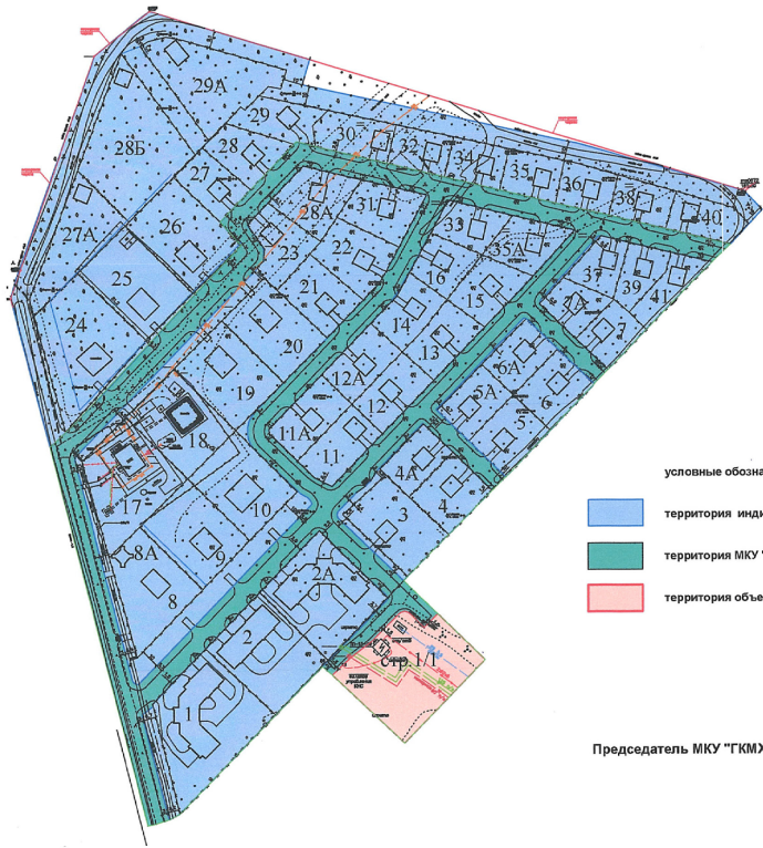
СХЕМА БЛАГОУСТРОЙСТВА И УБОРКИ ТЕРРИТОРИЙ ЗАТО г. РАДУЖНЫЙ