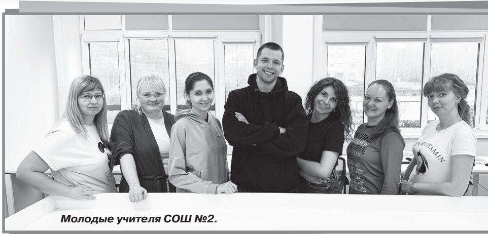
Молодые учителя СОШ №2.

Команда молодых педагогов школы №2 «7Я» заняла второе место. «7Я» - это семь