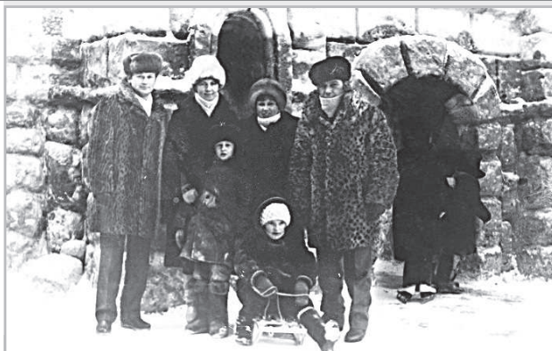
Лабиринт в парке, 1987 г.