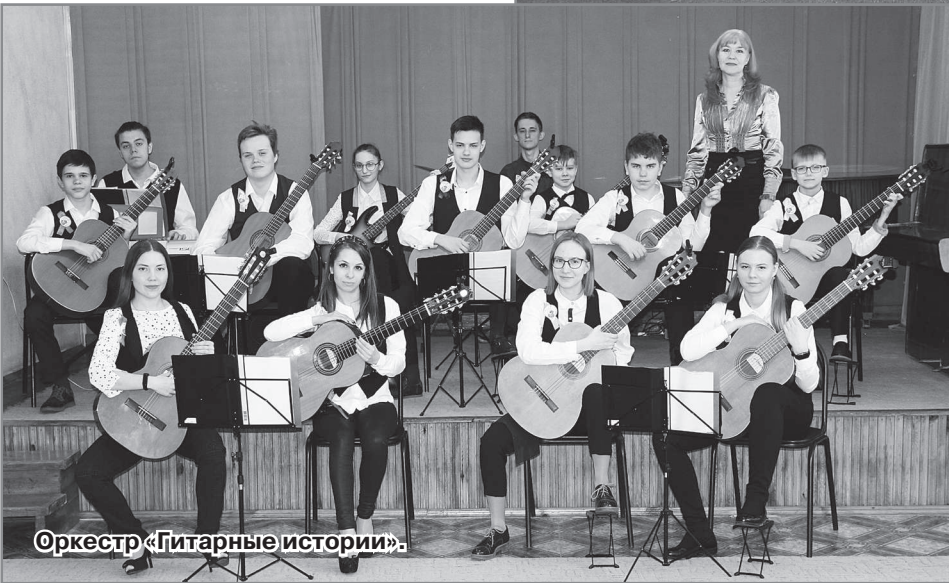
Оркестр «Гитарные истории».

ты крайне важен для получения качественного образования и является замечательным дополнением к классно-урочному процессу обучения.