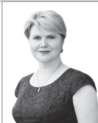
Первую прививку нам сделали ещё 22 декабря.

- Меня не надо было уговаривать, это было моим глубоким убеждением и желанием - сделать прививку от коронавируса, причём как можно быстрее. Я живу с родителями, им по 70 лет, сама не болела, и очень боялась принести инфекцию домой, заразить родителей.