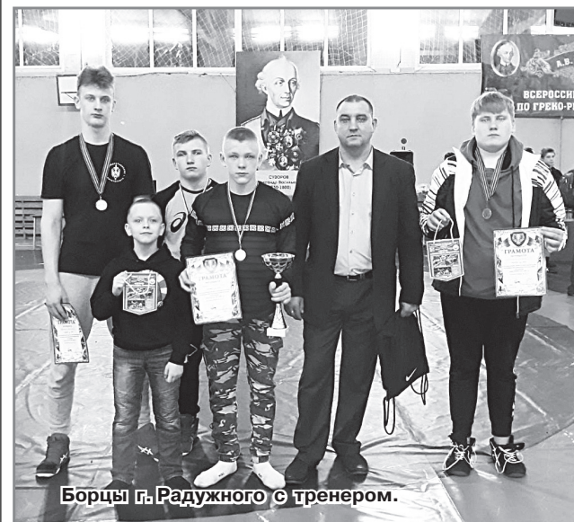
Борцы г. Радужного с тренером.

Администрация ДЮСШ.