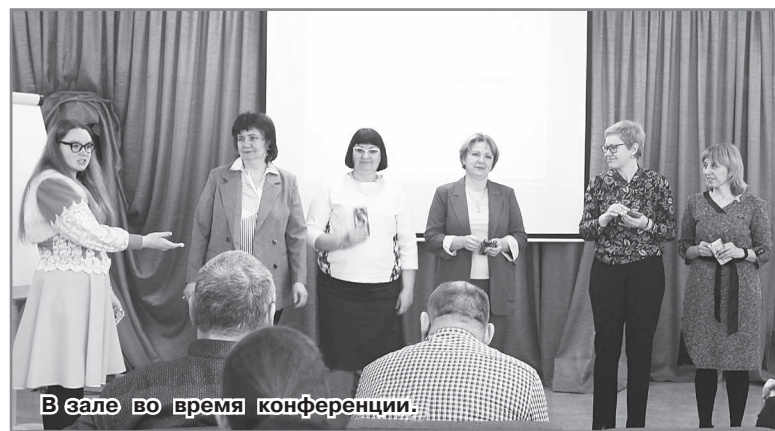
В зале во время конференции.

В этом году свой мастер-класс предложили студенты 2-го курса филологического факультета Педагогического института ВЛГУ, они были приглашены управлением образования с целью привлечения молодых кадров в школы нашего города. Девушки-студентки провели урок-викторину по достижениям в культуре и образовании Петровской эпохи 18-го века: