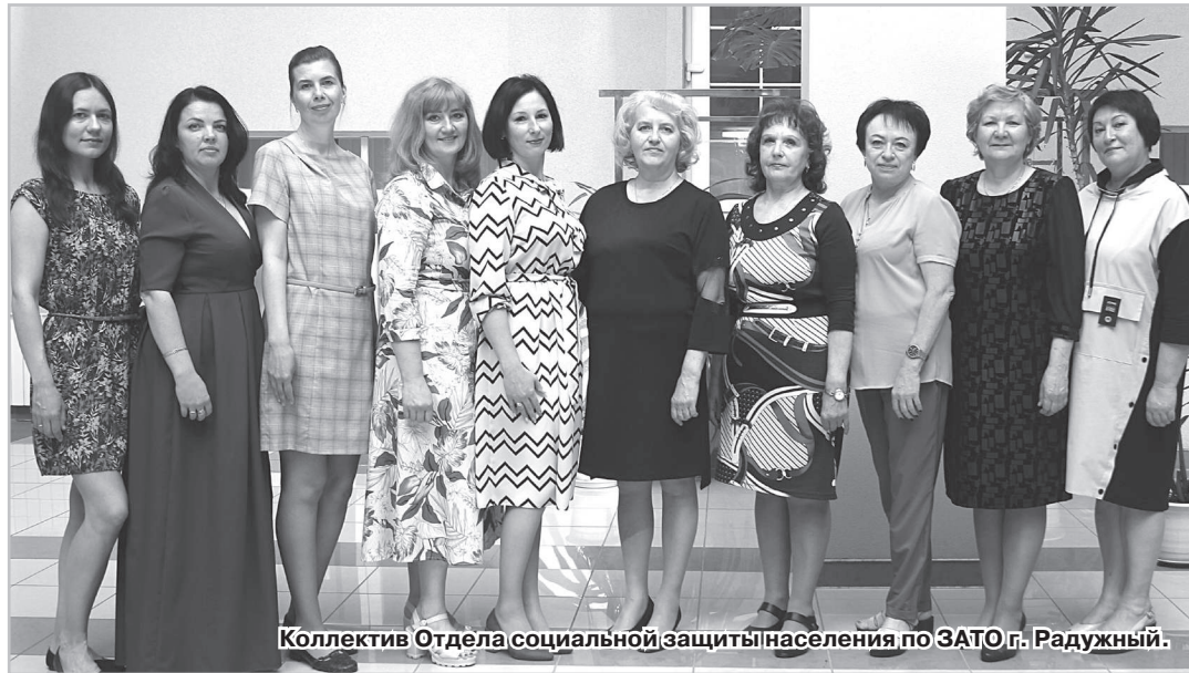
Коллектив Отдела социальной защиты населения по ЗАТО г. Радужный.