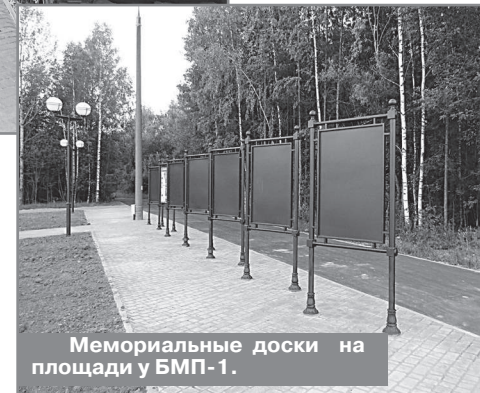
Мемориальные доски на площади у БМП-1.

Хочется надеяться, что подрядчик всё же найдется, и в 17-м квартале для удобства пешеходов появится новая пешеходная дорожка. Совсем недавно в третьем квартале в районе дома №19 появилась новая современная детская площадка, которая сразу приковала к себе внимание детворы разного возраста. И вот в скором времени новая площадка для детей будет установлена в первом квартале.