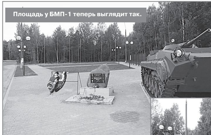
Площадь у БМП-1 теперь выглядит так.

на ООО «Слобода». Срок выполнения работ по условиям контракта с 16 мая по 15 июля 2022 года. Здесь выполнен ремонт тротуара, установлены светильники и мемориальные доски, проведено озеленение. Подрядная организация приступила к работам в конце марта, завершила их в начале июня. Работы по благоустройству общественной территории выполнены в полном соответствии с условиями муниципального контракта.