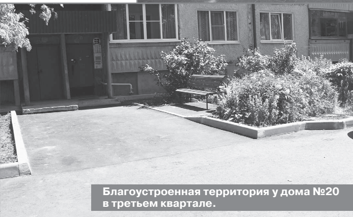
Благоустроенная территория у дома №20 в третьем квартале.

третьего квартала составляет 3 817 426,39 рублей. Срок выполнения работ по условиям контракта - с 16 мая по 15 июля 2022 года. По данным дворовым территориям предусмотрены следующие виды работ: асфальтобетонное покрытие проезжей части, тротуаров, замена бортового камня, замена урн и лавочек. Подрядная организация приступила к работам в конце апреля, завершила их в начале июня. В настоящий момент работы по благоустройству дворовых территорий выполнены в полном объеме, в соответствии с условиями муниципального контракта.