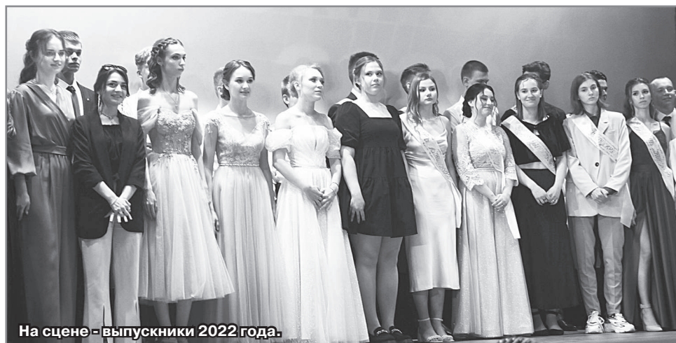
На сцене - выпускники 2022 года.