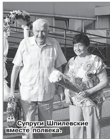
Супруги Шпилевские вместе полвека.

Ведущая мероприятия Ольга Елисеева предложила всем желающим написать свои самые сокровенные пожелания на традиционной ромашке, которая в конце праздника будет запущена в небо, с надеждой на то, что всё обязательно сбудется.