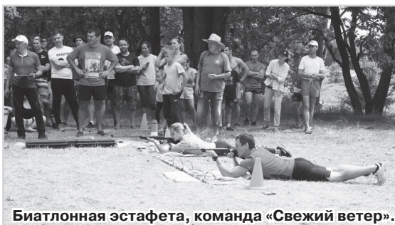
Биатлонная эстафета, команда «Свежий ветер».