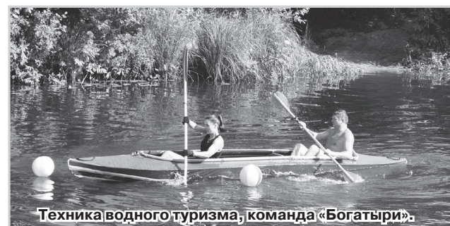
Техника водного туризма, команда «Богатыри».