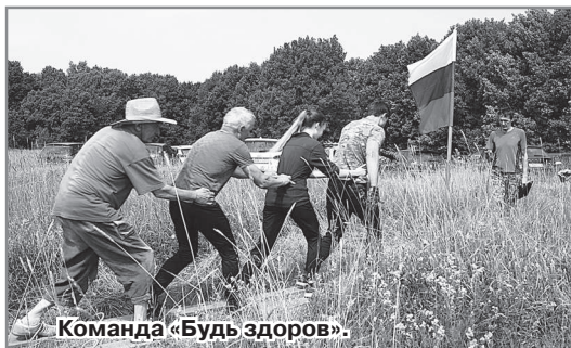
Команда «Будь здоров».