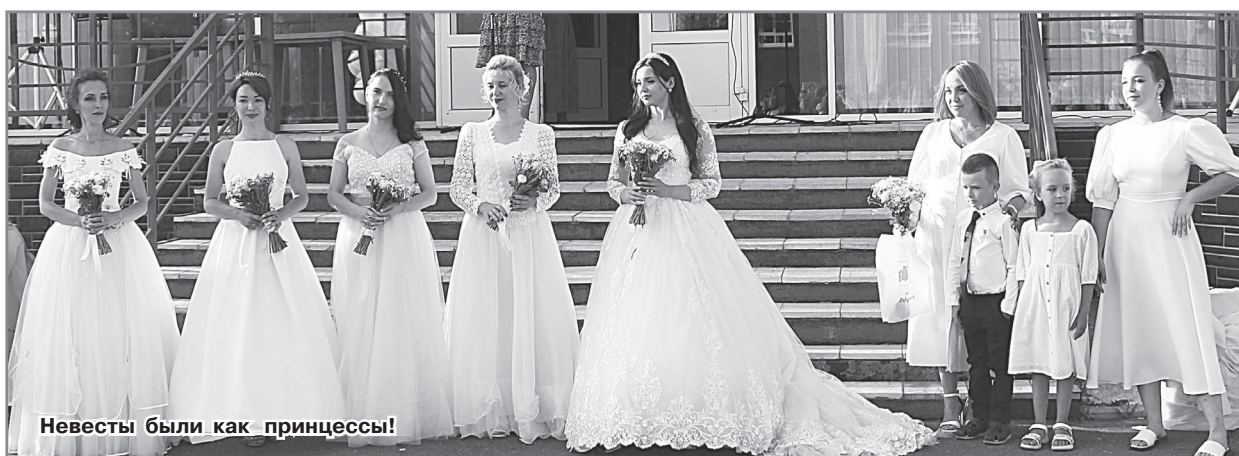
Невесты были как принцессы!