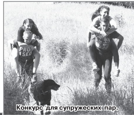
Конкурс для супружеских пар.