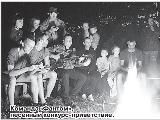
Команда «Фантом», песенный конкурс-приветствие.