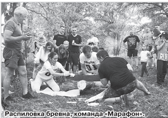
Распиловка бревна, команда «Марафон».