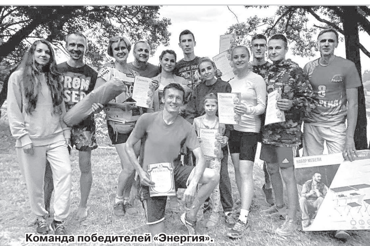
Команда победителей «Энергия».