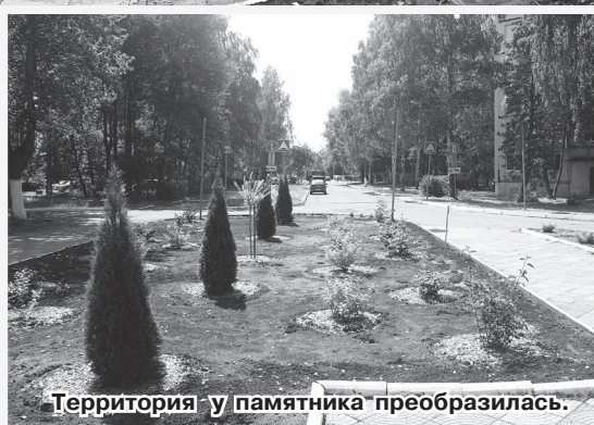
Территория у памятника преобразилась.