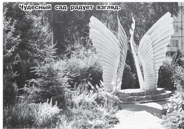
Чудесный сад радует взгляд.