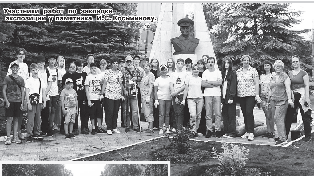
Участники работ по закладке экспозиции у памятника И.С. Косьминову.

В. СКАРГА.