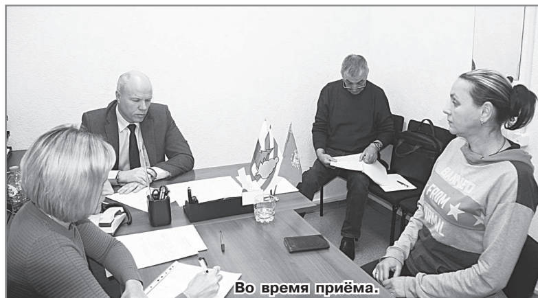
Во время приёма.

Все поступившие вопросы приняты к рассмотрению, в установ-