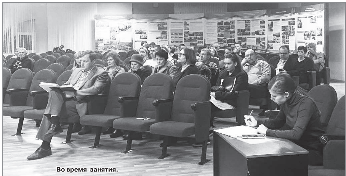
Во время занятия.