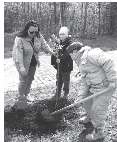
А в настоящее время в память о Победе сирень высаживают у памятных мест Великой Отечественной войны.

Кстати, для посадки в рамках акции «Сад памяти» организаторы не случайно выбрали сирень. Ведь именно сирень является символом Победы в Великой Отечественной войне. Она цветет в мае-июне, и в 1945 году именно сиренью советские граждане закидывали поезда с воинами-победителями, возвращающимися из Германии, пышные ветки сирени дарили солдатам, вернувшимся с фронта. По воспоминаниям современников, с 9 мая до парада Победы 24 июня 1945 года над Москвой стоял густой душистый запах сирени, который навсегда связался в памяти людей с огромной радостью Победы.