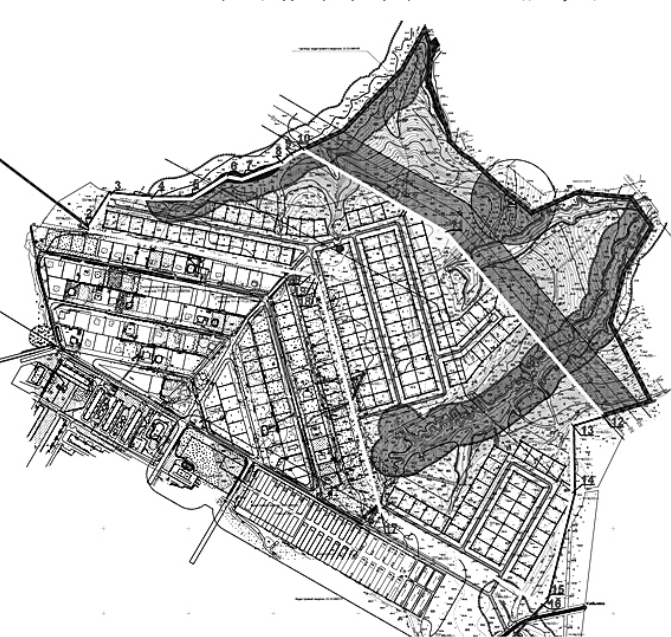
Приложение № 2 к решению Совета народных депутатов ЗАТО г. Радужный Владимирской области от 19.06.2023 года № 12/51