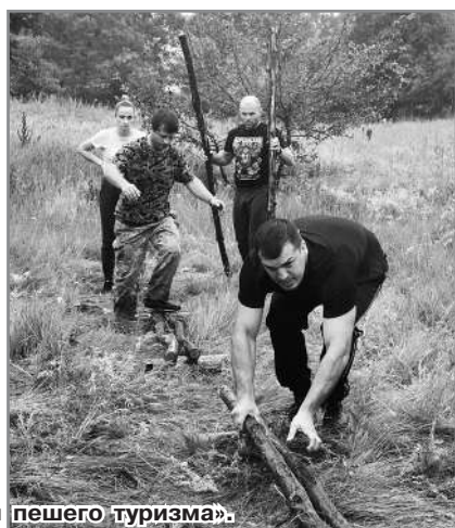
На этапах «Техники пешего туризма».