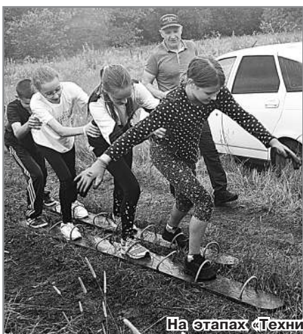
На этапах «Техники пешего туризма».