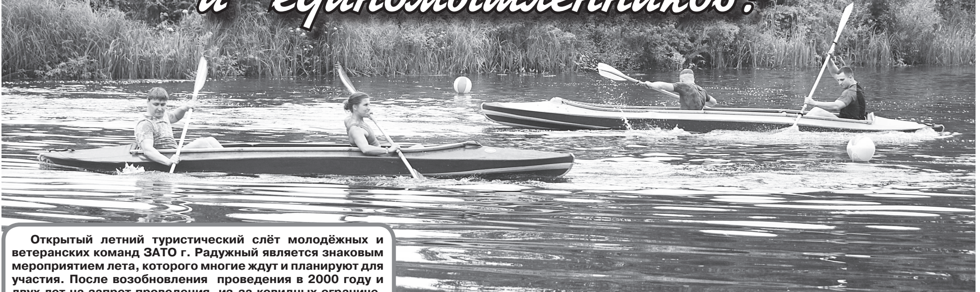
На этапе «Техника водного туризма».

Открытый летний туристический слёт молодёжных и ветеранских команд ЗАТО г. Радужный является знаковым мероприятием лета, которого многие ждут и планируют для участия. После возобновления проведения в 2000 году и двух лет на запрет проведения из-за ковидных ограничений в 2020-м и 2021-х годах, 7-9 июля 2023 года он проводится в 22-й раз.