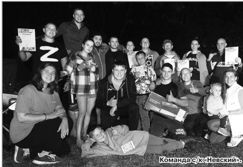
Команда с/к «Невский».

И завершал турслет самый эмоциональный и зрелищный вид - перетягивание каната. По шесть человек с каждой стороны, одна