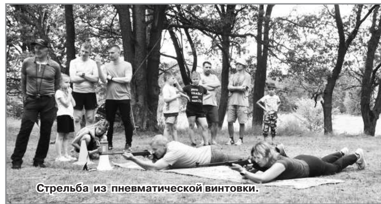
Стрельба из пневматической винтовки.

На берегу Рогановского озера с 7 по 9 июля прошел ежегодный летний туристический слёт. Для участия в спортивных соревнованиях в пятницу, в день заезда, заявили 9 команд, из которых две команды, состоявшие из детей. Многие участники приезжают сюда уже много лет, а какие-то из команд в этом году были дебютантами.