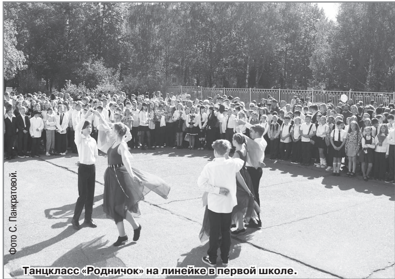
Танцкласс «Родничок» на линейке в первой школе.