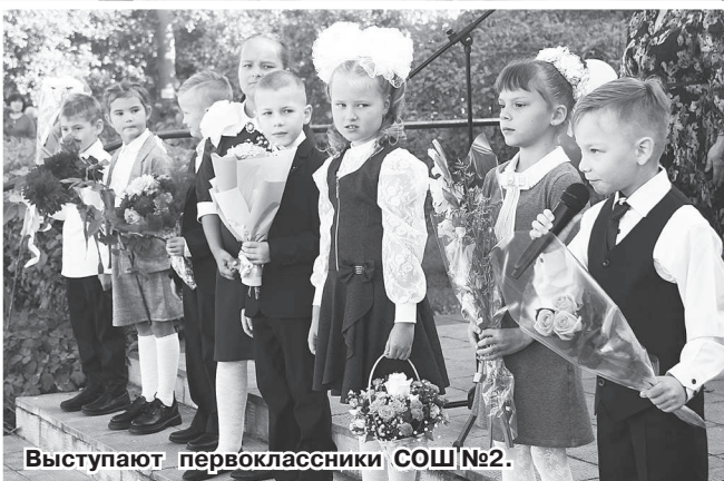
Выступают первоклассники СОШ №2.