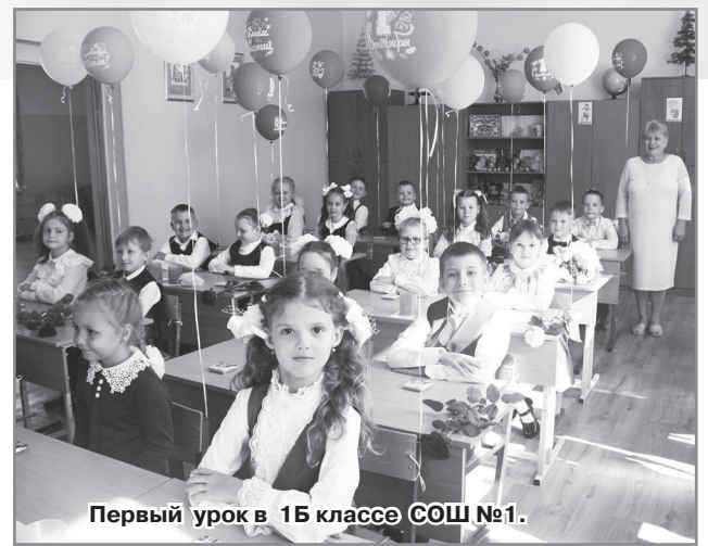
Первый урок в 1Б классе СОШ №1.