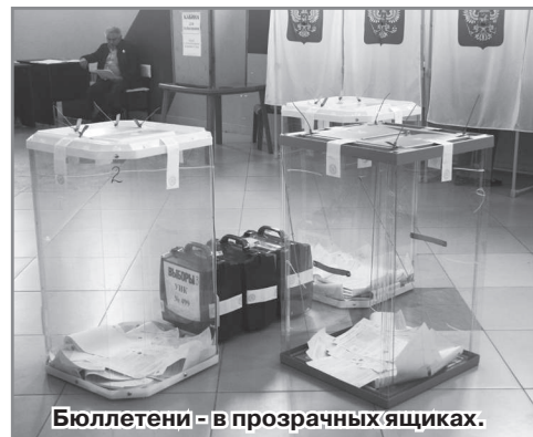
Бюллетени - в прозрачных ящиках.