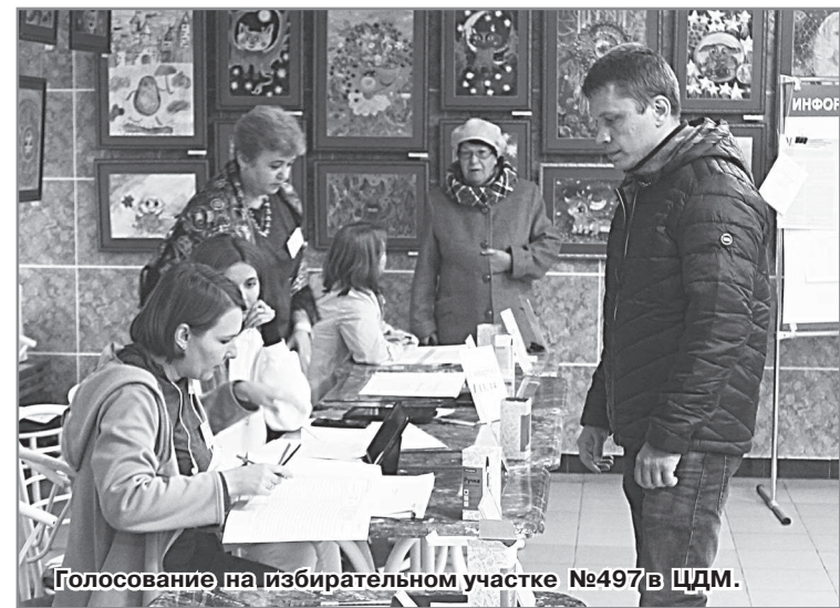
Голосование на избирательном участке №497 в ЦДМ.