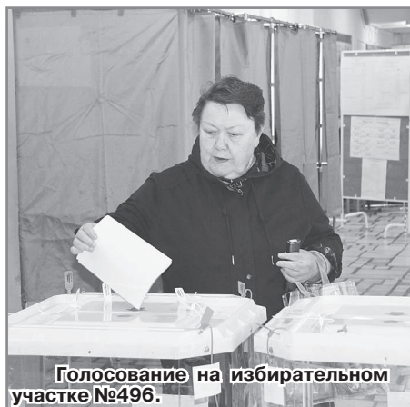
Голосование на избирательном участке №496.

ва выдать ему бюллетень. Отмечу, что у нас самый «возрастной» участок, много пожилых избирателей. И сегодня приходит много людей возраста «60+». А вот молодежи приходит очень мало.