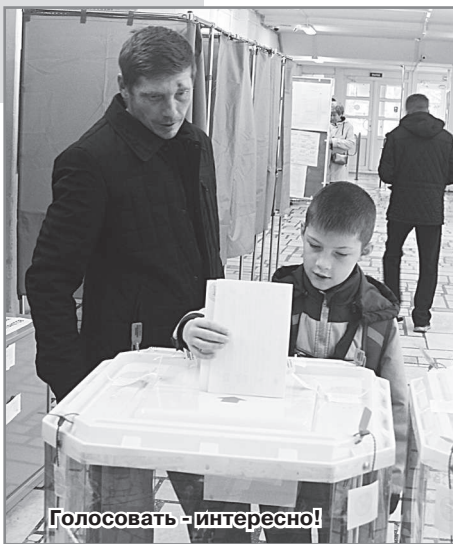
Голосовать - интересно!

Избирательный участок №499 расположен в Молодёжном спортивно-досуговом центре. В дневные часы воскресенья здесь также особого ажиотажа не наблюда-