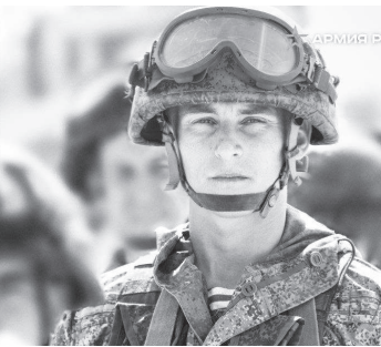
Военный комиссариат г. Радужного.