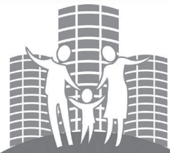
Рисунок может быть выполнен в любой технике, обязательно должен быть указан автор, его возраст и контактный телефон представителя. Победители будут определены в четырёх возрастных категориях: до 7 лет; с 8 до 10 лет; с 11 до 14 лет; с 15 до 17 лет.

Министерство жилищно-коммунального хозяйства и Фонд капитального ремонта многоквартирных домов Владимирской области проводят конкурс детских рисунков по темам «ЖКХ - это люди» и «Мы рисуем энергоэффективный капремонт».