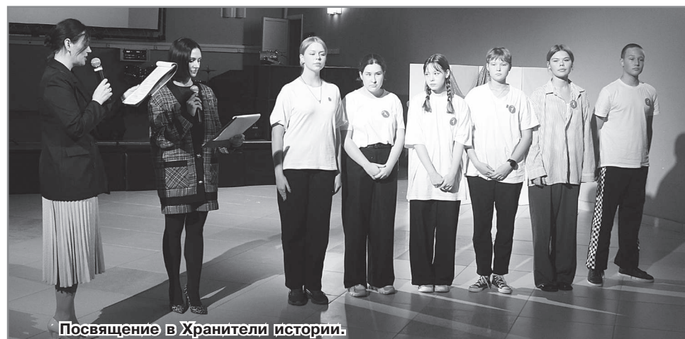
Посвящение в Хранители истории.