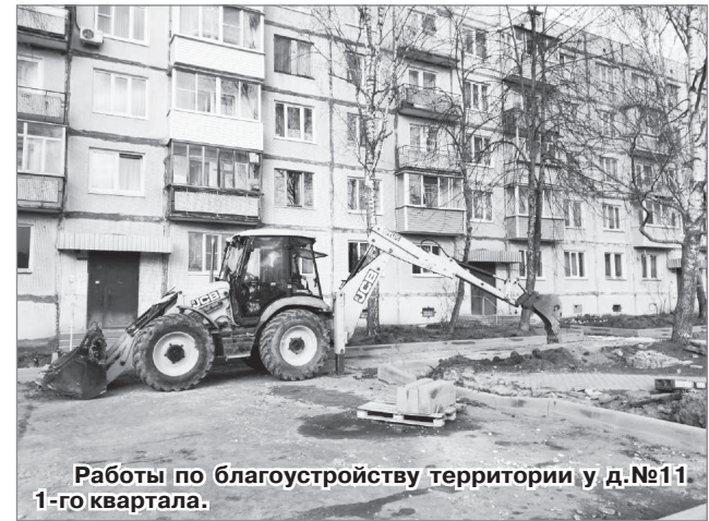
Работы по благоустройству территории у д.№11 1-го квартала.

- В рамках реализации Федерального проекта «Формирование комфортной городской среды» Национального проекта «Жилье и городская среда» с 2018 года на территории ЗАТО г. Радужный проводятся работы по благоустройству дворовых и общественных территорий. Всего за этот период были отремонтированы территории 21 многоквартирного дома, а также выполнены работы на двух общественных территориях.