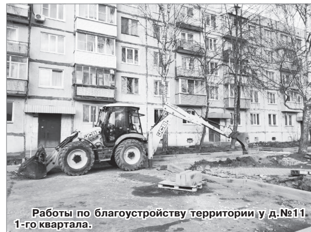
Работы по благоустройству территории у д.№11 1-го квартала.

- В рамках реализации Федерального проекта «Формирование комфортной городской среды» Национального проекта «Жилье и городская среда» с 2018 года на территории ЗАТО г. Радужный проводятся работы по благоустройству дворовых и общественных территорий. Всего за этот период были отремонтированы территории 21 многоквартирного дома, а также выполнены работы на двух общественных территориях.