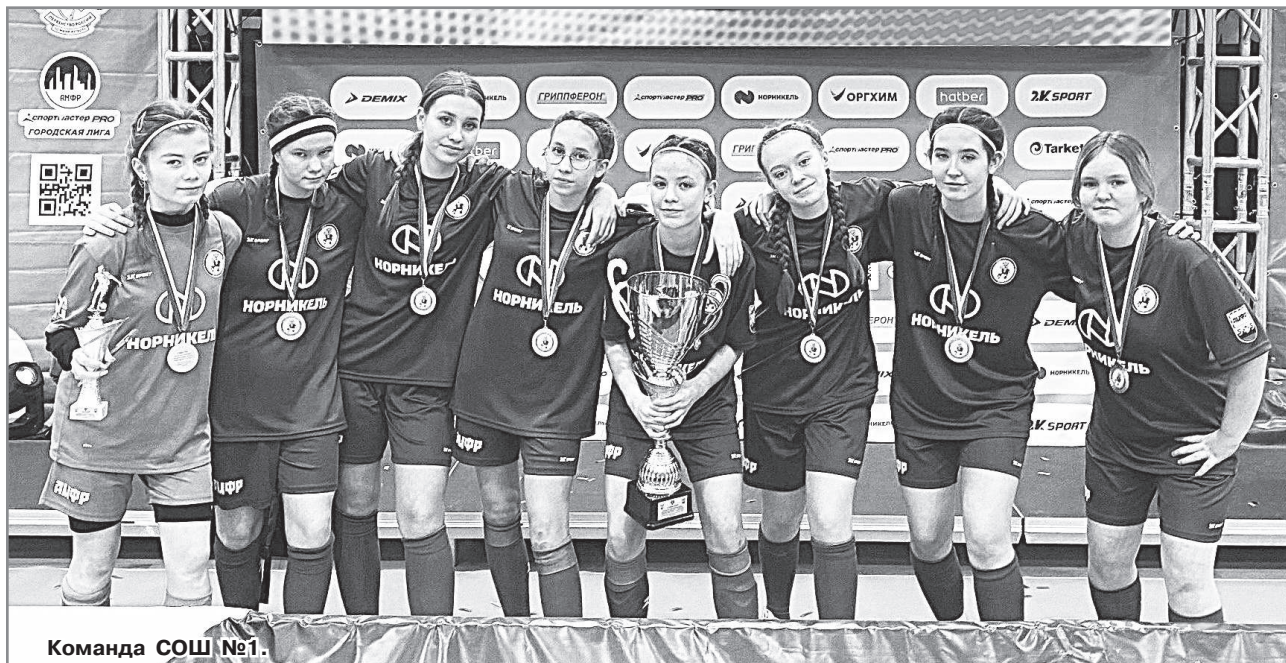
Команда СОШ №1.

Администрация ЗАТО г. Радужный.