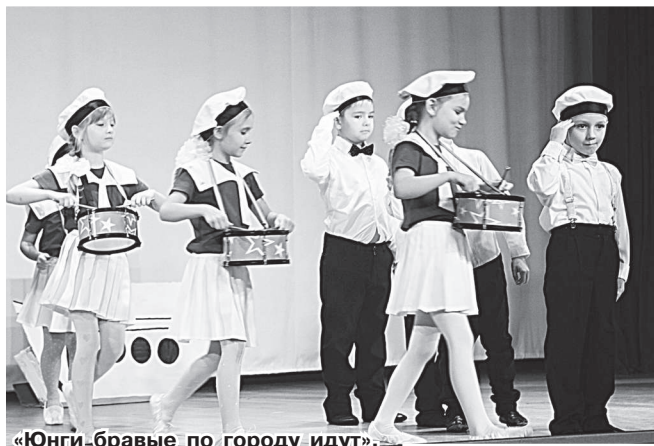
«Юнги-бравые по городу идут».

Во все времена в России воспевался воинский подвиг. Независимо от праздников и дат. Сегодняшнее поколение чтит и поддерживает традиции своей страны. В Радужном в канун Дня защитника Отечества ежегодно проводится городской фестиваль лирико-патриотической песни. В этом году он состоялся 20 февраля в зале культурного центра «Досуг». Организаторы назвали его «Моё Отечество - моя Россия».