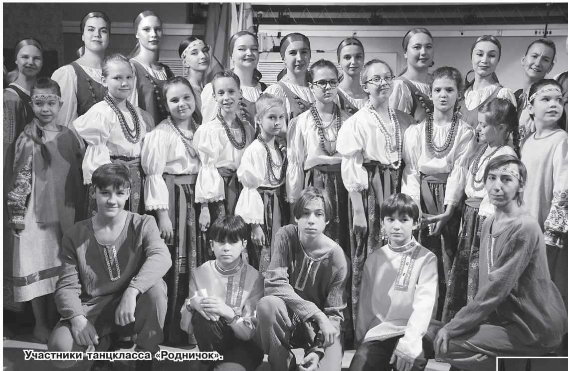
Участники танцкласса «Родничок».

В Молодёжном спортивно-досуговом центре 4 ноября прошло праздничное мероприятие, посвящённое государственному празднику - Дню народного единства. Песни о любимой Родине, красивые танцевальные композиции, акция по вручению паспортов юным гражданам России - вот чем запомнится оно всем, кто на нём побывал.