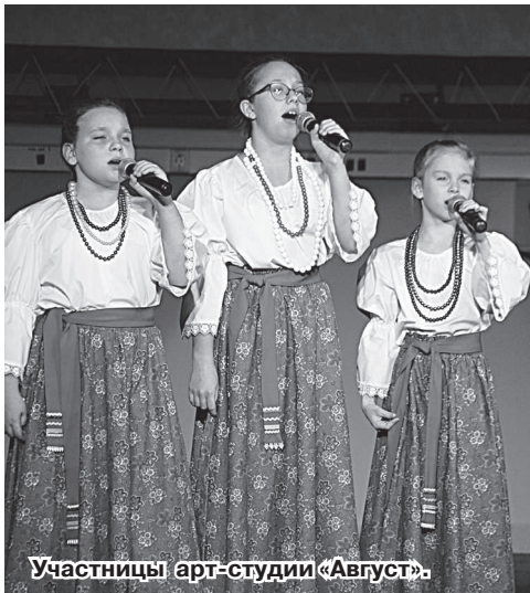
Участницы арт-студии «Август».

род или дом, разделившийся сам в себе, не устоит. Мф.12:25». Напомнил протоиерей и о том, что православным людям свойственно уважительное отношение к представителям других верований и религий, стремление к справедливости, миролюбию. Он говорил также, что в наше непростое время важно сохранять единство в обществе, понимать, что наши воины там, на линии фронта, воюют за счастье и спокойную жизнь всего российского народа. И им необходима поддержка, в том числе и духовная. Завершая своё вы-