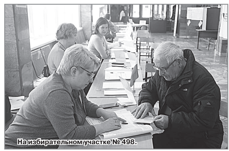
На избирательном участке № 498.