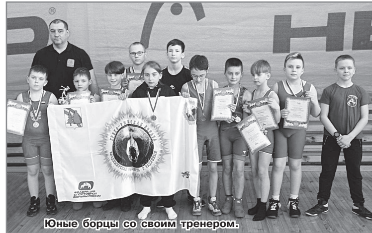
Юные борцы со своим тренером.

Поздравляем всех участников! Желаем дальнейших успехов и побед!