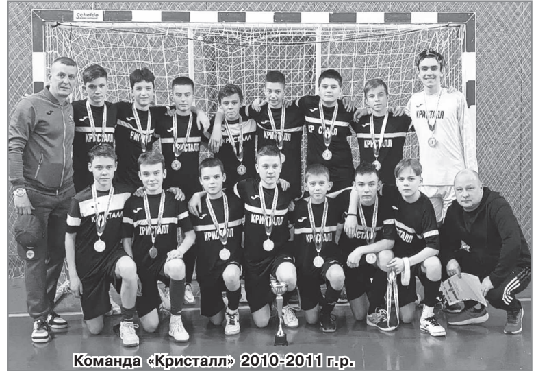
Команда «Кристалл» 2010-2011 г.р.

В финальном матче нашим соперником стала команда «Рубин» из пос. Балакирево. Игра проходила на равных, что отразилось на счете