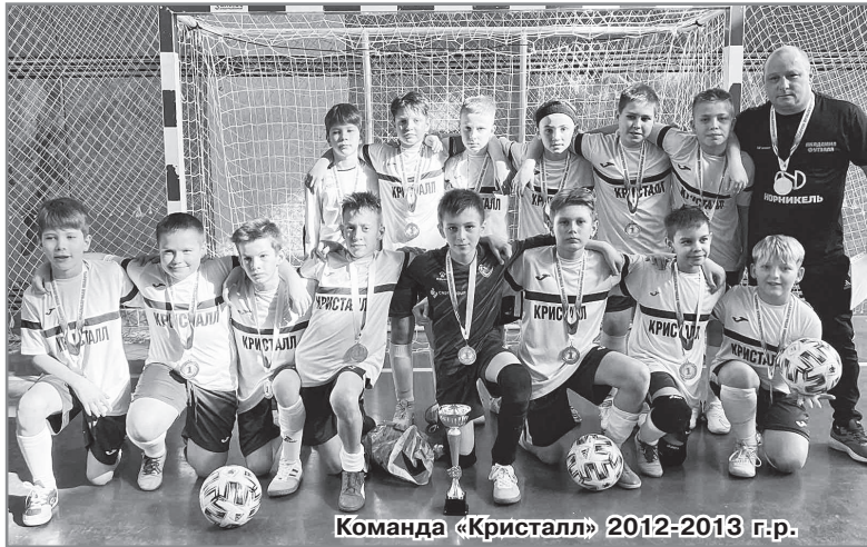
Команда «Кристалл» 2012-2013 г.р.

С 19 по 26 марта эти команды представляют наш город и Владимирскую область на Первенстве России по мини-футболу! Желаем ребятам удачи! Только вперед, «Кристалл»!