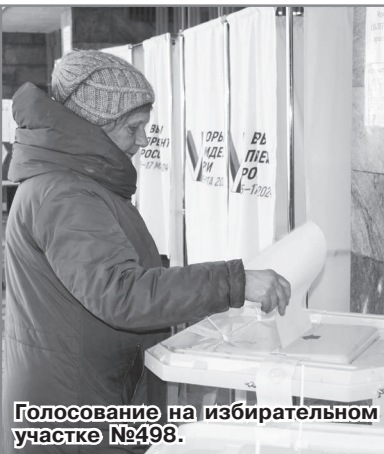
Голосование на избирательном участке №498.