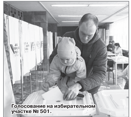
Голосование на избирательном участке № 501.