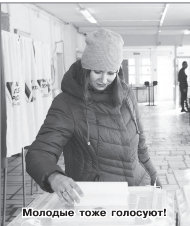
Молодые тоже голосуют!

В Радужном на шести избирательных участках в течение трёх дней, 15, 16 и 17 марта, также активно шло голосование на выборах Президента РФ. Радужане показали хорошие результаты по явке на избирательные участки. Голосовали и с помощью ДЭГ (дистанционного электронного голосования). В нашем городе с учётом данных ДЭГ количество проголосовавших составило 61,98% от общего числа избирателей.