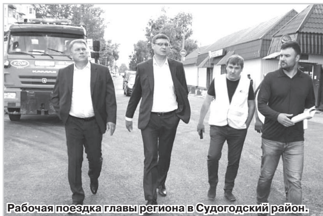
Рабочая поездка главы региона в Судогодский район.