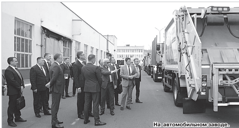
На автомобильном заводе.