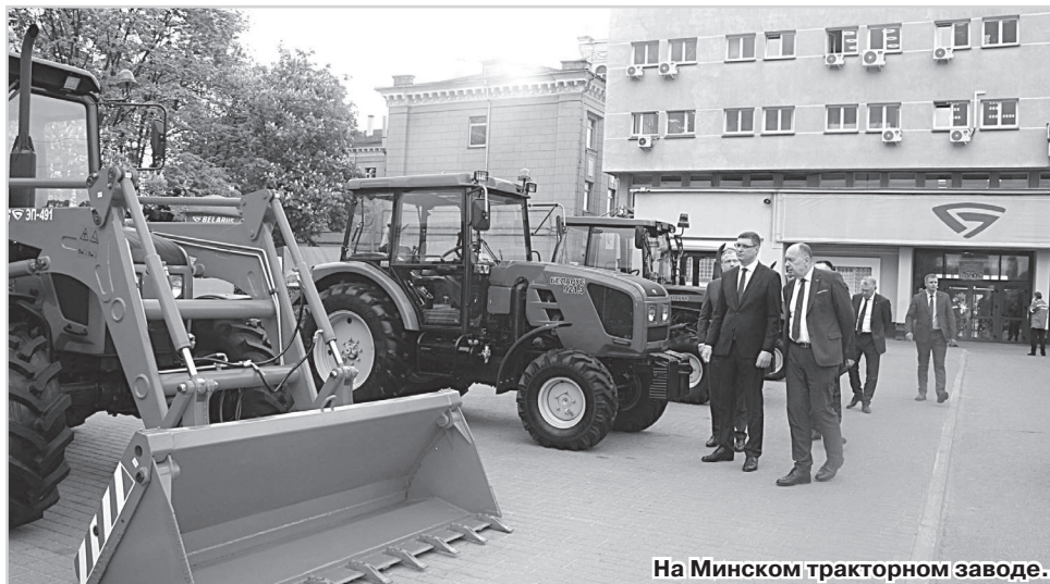
На Минском тракторном заводе.

Одним из них стал промышленный парк «Великий камень», который выполняет роль коммуникационного звена между Россией, СНГ и Европой. Он предоставляет компаниям доступ к готовой производственной, инженерно-транспортной, таможенной и социально-административной инфраструктуре, значительные налоговые преференции, а также особую систему обслуживания бизнеса.