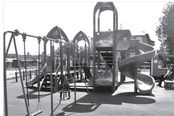
Управление массовых коммуникаций.

Итогом же работы по данному федеральному проекту в 2023 году должны стать 134 благоустроенных объекта.