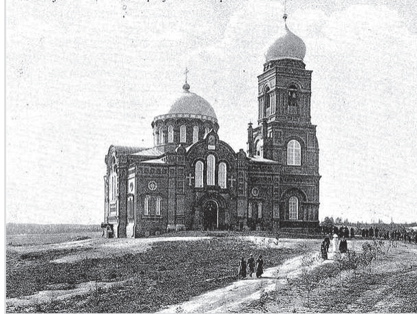
Село Буланово, Владимир. уезда. - Храмъ Влад. Б. М.

Духовная сфера и в настоящее время объединяет жителей Баглачево, в число которых