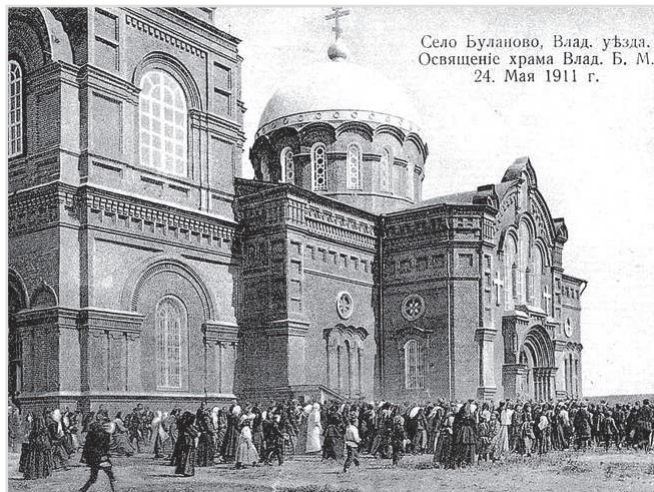
Село Буланово, Влад. уезда. Освящение храма Влад. Б. М. 24. Мая 1911 г.

Алексей Михайлов. Фото предоставлены автором.