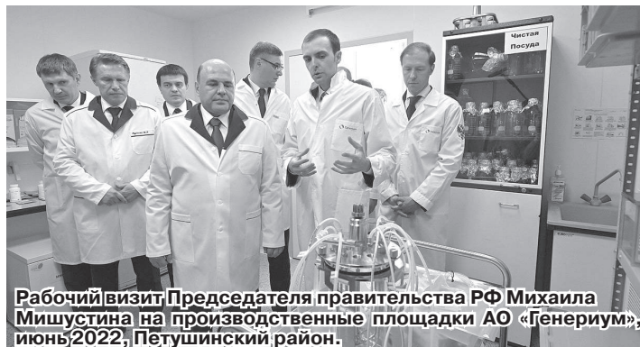
Рабочий визит Председателя правительства РФ Михаила Мишустина на производственные площадки АО «Генериум», июнь 2022, Петушинский район.