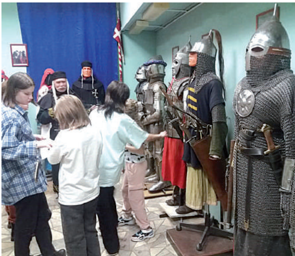
М.Васильцов. Фото предоставлено автором.

Весна-время походное. Хочется бежать наперегонки: с весенними ручейками... с плывущими облаками... с восторженными ветрами навстречу новому, неизведанному, увлекательному дню!