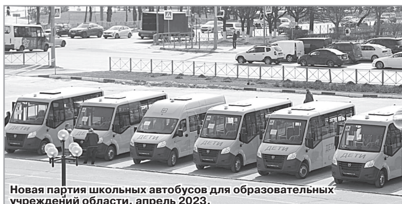
Новая партия школьных автобусов для образовательных учреждений области, апрель 2023.