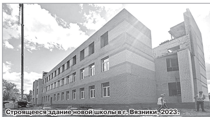
Строящееся здание новой школы в г. Вязники, 2023.

Сегодня уже со всей очевидностью можно сказать, что система образования Владимирской области активно встраивается в стратегию научно-технологического развития России. В частности, в 2025-2027 годах в регионе будет создана разветвлённая сеть пилотных площадок по образовательной робототехнике и искусственному интеллекту. Центром научно-методического сопровождения проекта определён детский технопарк «Кванториум-33». Кроме того, планируется дооснастить школьные кванториумы и «IT-кубы», а в областном центре «Олимп» – сформировать современную цифровую среду.