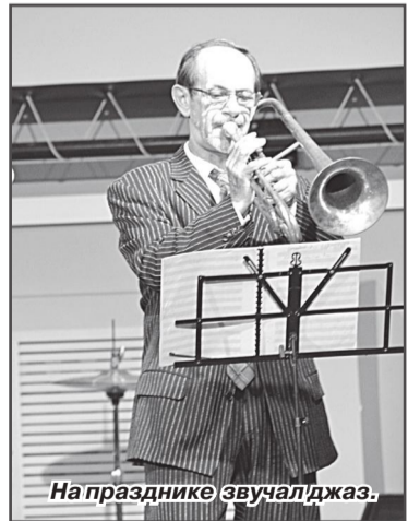
На празднике звучал джаз.