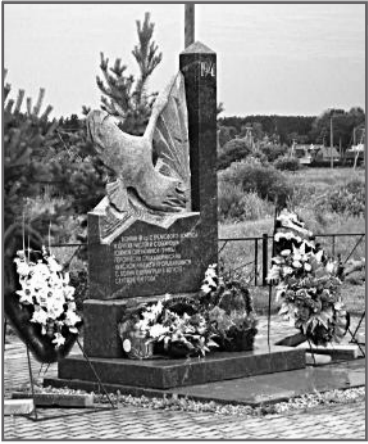
В Вахте Памяти, проходившей в июле на ленинградской земле, поисковики подняли останки 6 бойцов РККА и 2 солдат Вермахта.

Недалеко от грунтовой дороги, посреди площадки в утоптанной траве мелькают лопаты, и в разные стороны летит влажный песок. Это роют не траншею под фундамент нового дома, не котлован под бассейн... Поисковики ищут останки погибшего во время войны человека.