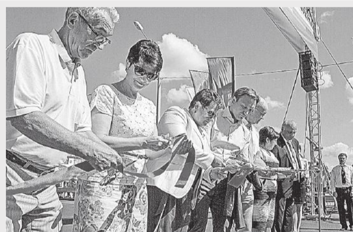
Пуск новых объектов Лыбедской магистральной

Главной темой совещания стали итоги развития промышленного сектора региона-33 за первое полугодие. Состоялся серьезный, откровенный