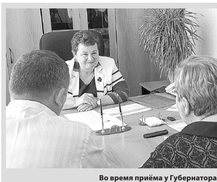
Во время приема у Губернатора

Активисты из городов и районов области просили Губернатора помочь