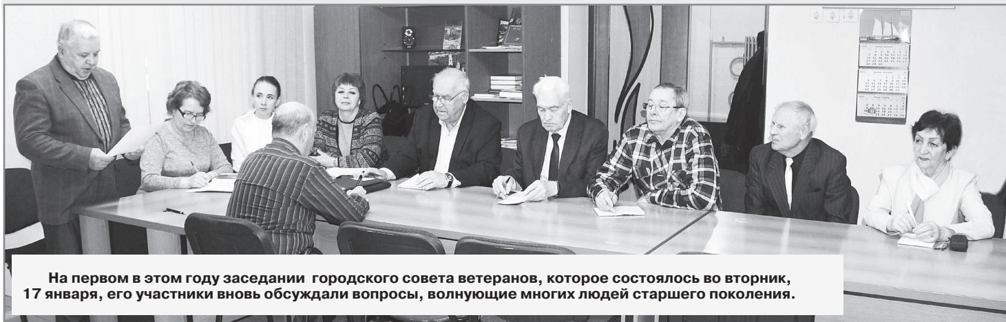
На первом в этом году заседании городского совета ветеранов, которое состоялось во вторник, 17 января, его участники вновь обсуждали вопросы, волнующие многих людей старшего поколения.