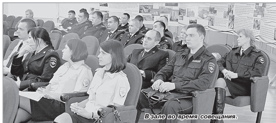
В зале во время совещания.