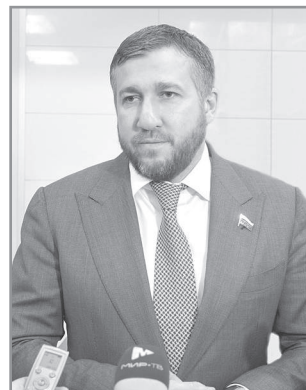
Депутат Госдумы Григорий Аникеев: