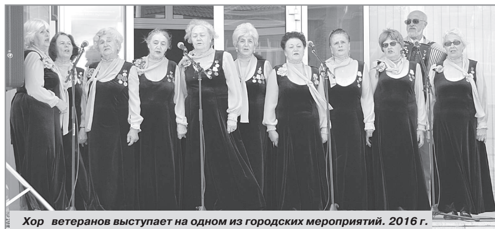
Хор ветеранов выступает на одном из городских мероприятий. 2016 г.

Во Владимире, на Добросельской, 2г, в общественной организации «Милосердие и порядок» состоялось торжественное награждение победителей грантовой программы депутата Госдумы Григория Аникеева.