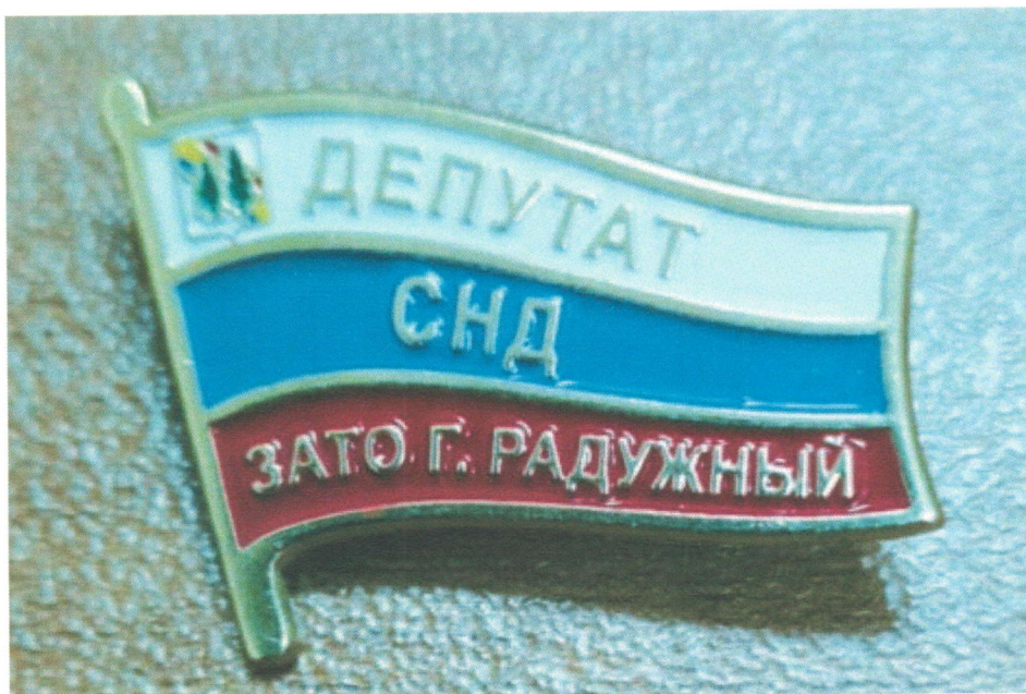
Образец нагрудно го знака: