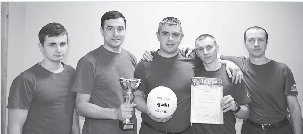
Н. Парамонов. На фото - команда «МЧС».

Очередные виды спартакиады – биатлонная эстафета и лыжные гонки состоятся ориентировочно в феврале после установления достаточного снежного покрова.