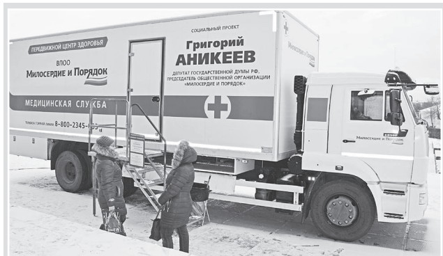
Жители Юрьев-Польского района обследовались в «Передвижных центрах здоровья»

Проект стартовал в ноябре 2015 года. За это время медицинские комплексы объехали свыше 160 населенных пунктов региона, бесплатные обследования