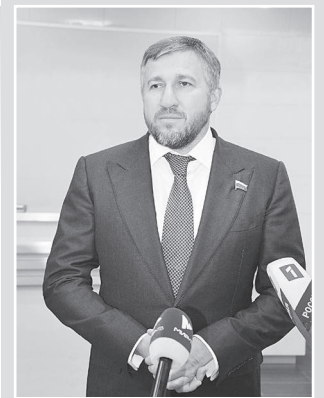
Депутат Госдумы Григорий Аникеев:

График выездов медицинских центров опубликован на сайте общественной организации «Милосердие и порядок», в районных газетах и в социальных сетях. Записаться на консультацию можно заранее по телефону бесплатной горячей линии: 8-800-2345-003.