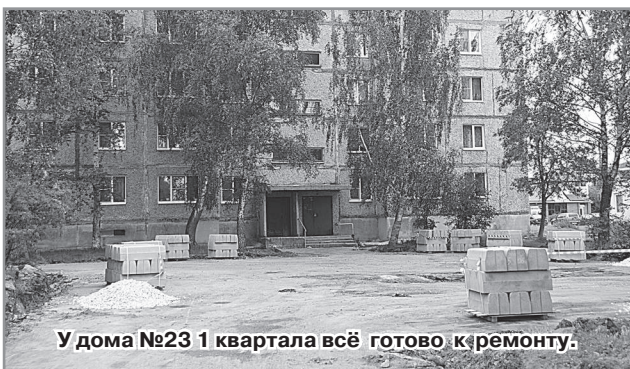
У дома №23 1 квартала всё готово к ремонту.

В этот период в общественную комиссию поступило 14 заявок от радужан. После рассмотрения и оценки комиссией 3 дворовые территории вышеуказанных домов были включены в подпрограмму. На них предусмотрено выполнение следующих работ: замена бортового камня, асфальтобетонное покрытие проезжей части и тротуаров, замена урн и лавочек. Управляющей организацией МУП «ЖКХ» были проведены собрания с собственниками жилых помещений в этих домах для получения их согласия на финансирование ремонтных работ в размере 5% от их стоимости.