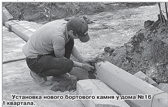
Установка нового бортового камня у дома №16 1 квартала.