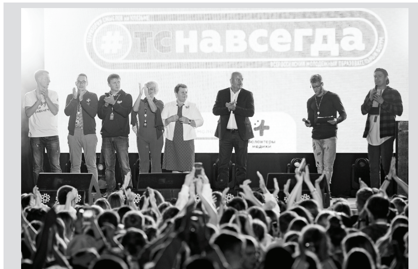
Во время встречи на «Территории смыслов».