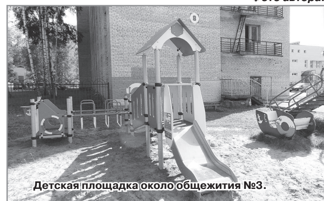
Детская площадка около общежития №3.