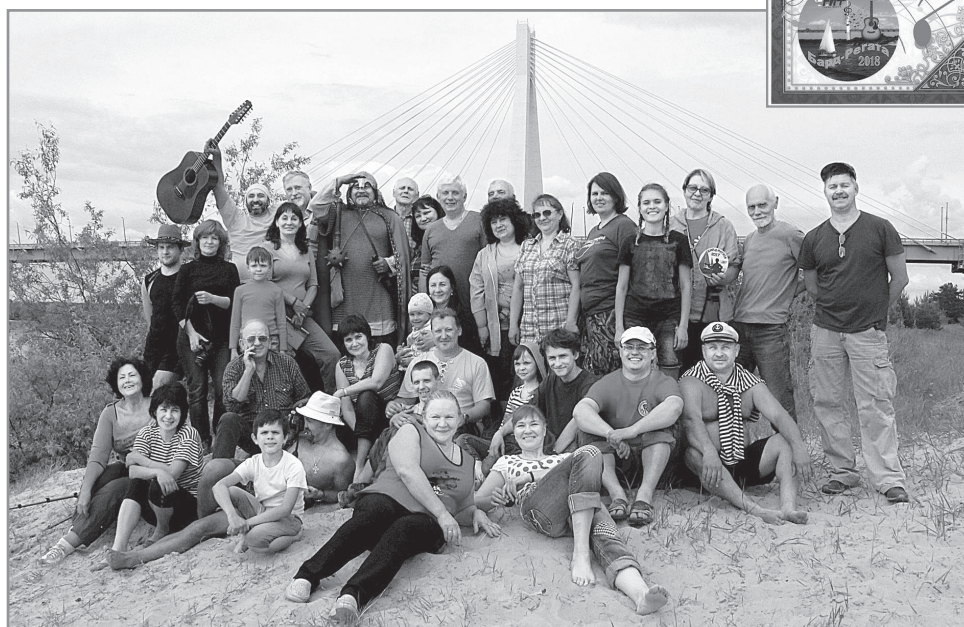
Фото предоставлено Н. Копань.