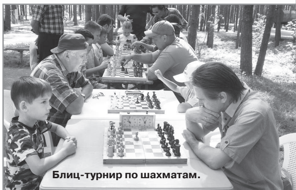
Блич-турнир по шахматам.

В турнире участвовали как взрослые шахматисты, так и совсем юные ребята. Дружеские сражения на шахматных досках развернулись нешуточные. Каждый участник старался, чтобы победа досталась ему. Неожиданностью для бывалого игрока закончился блич с юным дарованием, ведь мат ему поставил мальчик на последней секунде! Улыбается: «Хорошее поколение