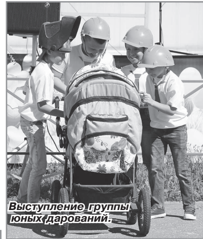
Выступление группы юных дарований.

День строителя — это не просто праздник. Это ещё и хорошая возможность посмотреть на знакомый город по-другому. Ведь можно просто знать, что 16 мая 1972 года был заложен первый дом нашего города, знать, как поэтапно создавался Радужный. А можно увидеть