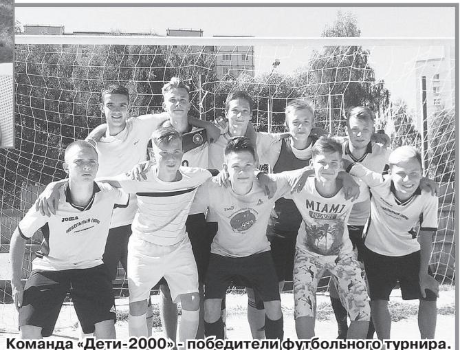
Команда «Дети-2000» - победители футбольного турнира.

Ирина Митрохина.