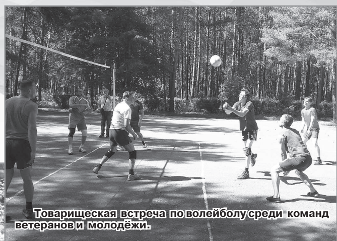
Товарищеская встреча по волейболу среди команд ветеранов и молодёжи.