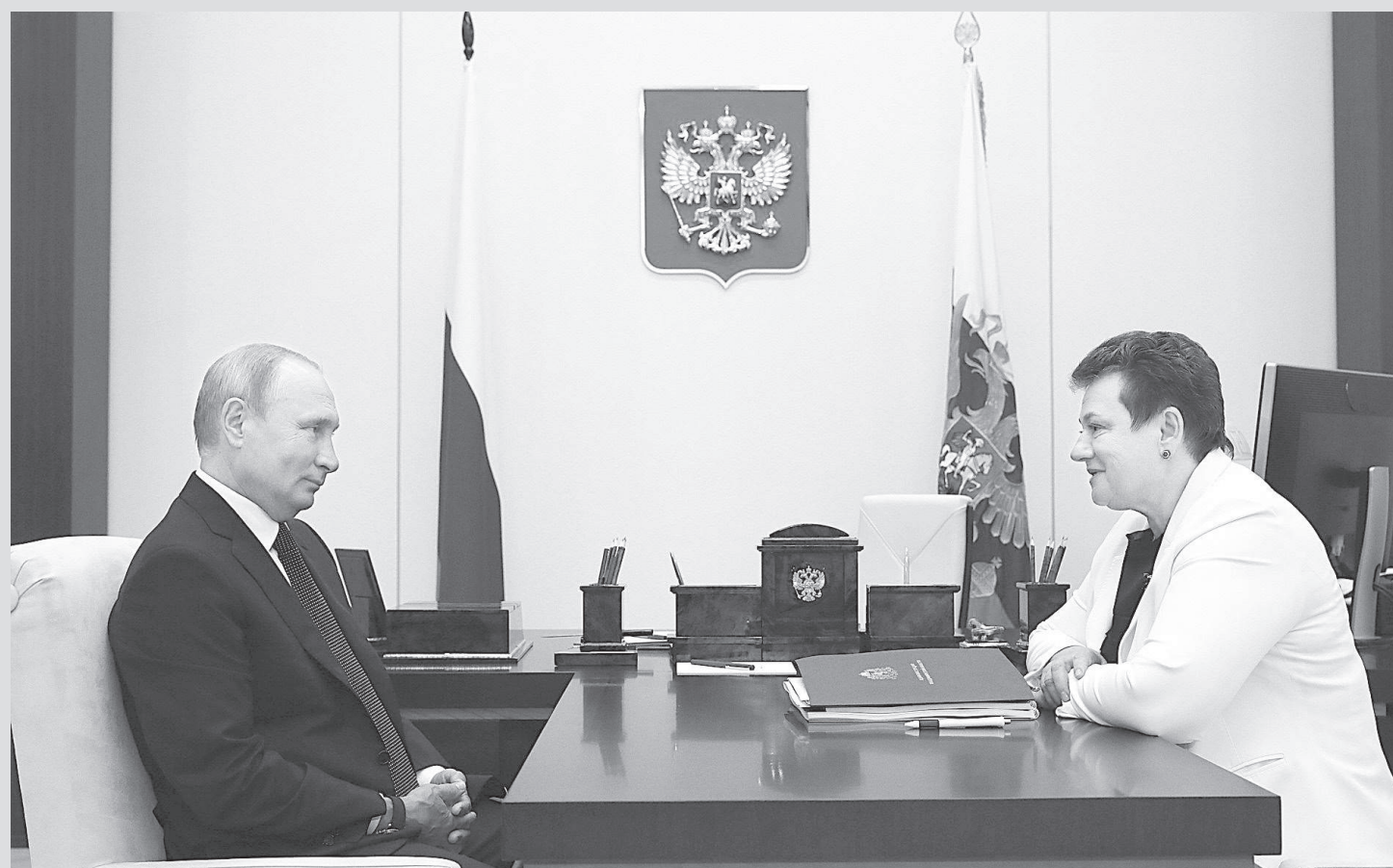
Во время встречи с Президентом России Владимиром Путиным.

Отдельно Владимир Путин поинтересовался развитием социальной сферы.