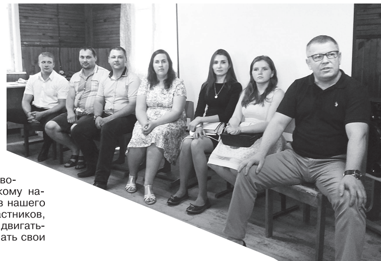
Совет народных депутатов ЗАТО г. Радужный.