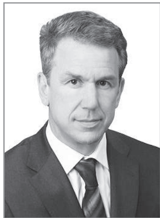
Уважаемые жители г. Радужный!

Пять лет назад вы доверили мне представлять интересы ЗАТО г. Радужный в Законодательном Собрании Владимирской области. В региональном парламенте я был заместителем председателя комитета по аграрной политике, природопользованию и экологии, а также работал в комитете по