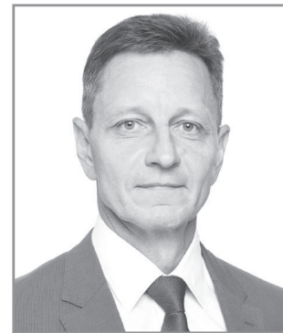
СИПЯГИН Владимир Владимирович

1954 года рождения, место жительства: Владимирская область, город Владимир; профессиональное образование: Уссурийский государственный педагогический институт, 1978 год; Хабаровская высшая партийная школа, 1991 год; основное место работы или службы, занимаемая должность (род занятий): администрация Владимирской области, Губернатор Владимирской области; выдвинута избирательным объединением «Владимирское региональное отделение Всероссийской политической партии «ЕДИНАЯ РОССИЯ»; член Всероссийской политической партии «ЕДИНАЯ РОССИЯ»; член Бюро Высшего совета Всероссийской политической партии «ЕДИНАЯ РОССИЯ»; член Высшего совета Всероссийской политической партии «ЕДИНАЯ РОССИЯ».