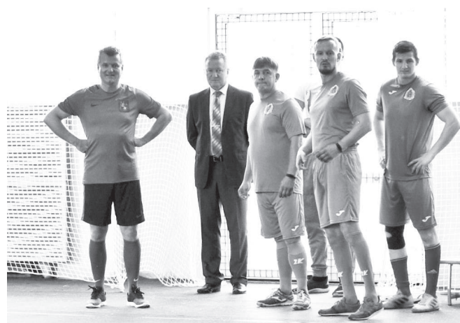
По информации пресс-службы администрации области.

подготовке воспитанников, проводить спортивные соревнования от внутришкольных до региональных. Мы уверены, что Кадетский корпус будет и дальше развиваться, и все вместе искренне говорим Вам спасибо!».