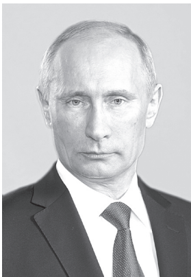
Президент России Владимир Путин направил приветствие участникам VI Владимирского экономического форума.