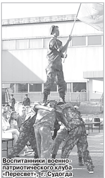
Воспитанники военно-патриотического клуба «Пересвет», г. Судогда.