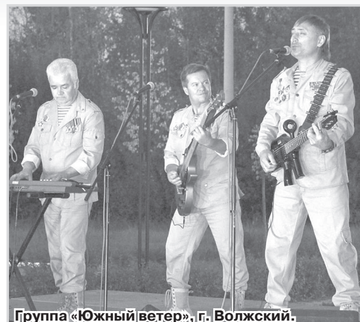
Группа «Южный ветер», г. Волжский.

Юбилейный фестиваль «Память из пламени» завершился, подарив всем - и участни-