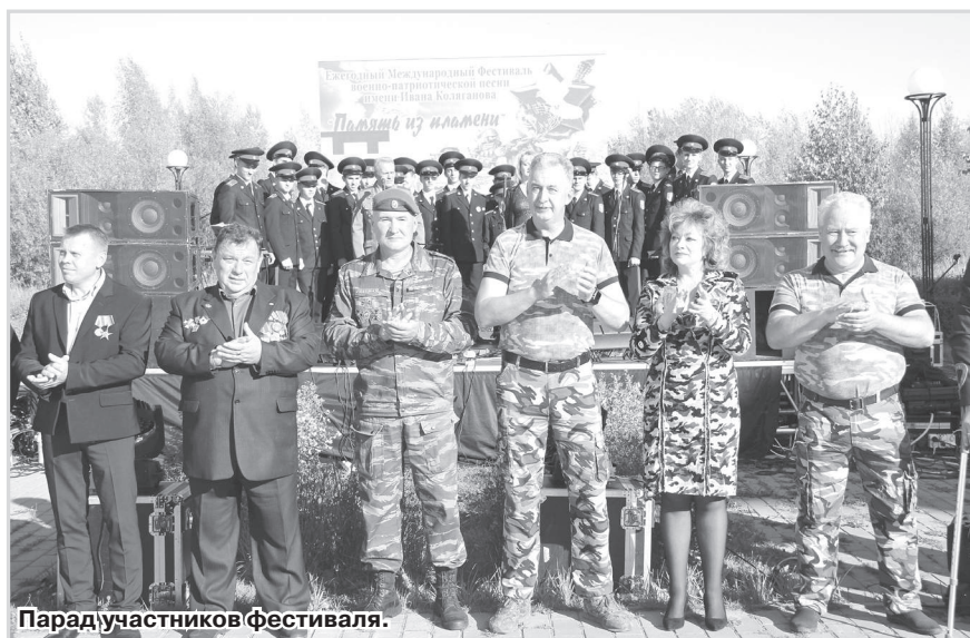
Парад участников фестиваля.