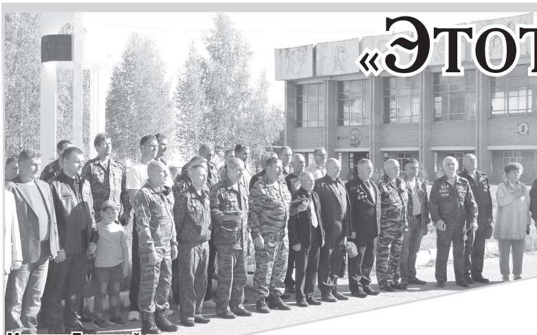
Митинг у Памятной стелы.