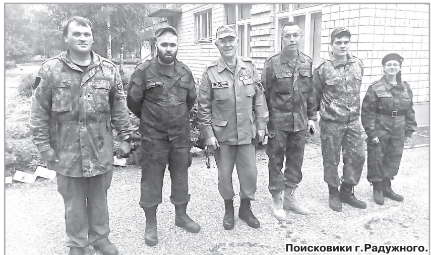
Поисковики г. Радужного.

Октябрьский лес был плохим укрытием от миномётных мин. Разрываясь среди веток и на земле, они поражали скучившихся людей и технику. Где-то рядом заржала раненая лошадь, забившись в оглоблях двуколки, осела на пробитых скатах дымящаяся «эмка». Впереди, за маленькой речкой, названия которой боец не знал, длинными очередями заходились немецкие пулемёты.